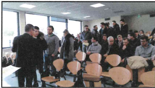
MENUISERIE ALUMINIUM-VERRE OUVRAGES DU BATIMENT METALLERIE