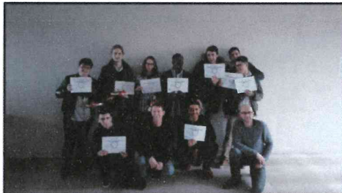
ECONOMIQUE ET SOCIALE