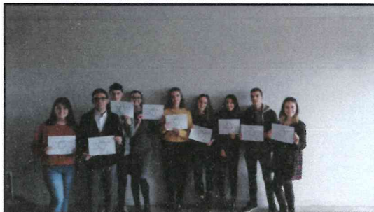
TECHNICIEN BAT. : ORG.REAL.GROS OEUVRE